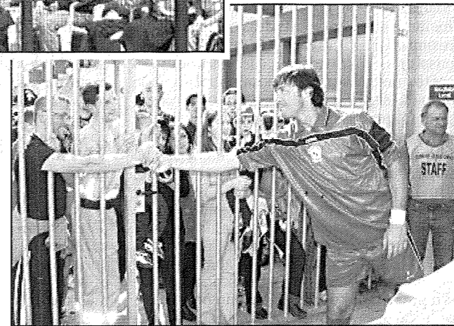
Walter Zenga, ex portiere dell'Inter e della Nazionale, saluta i tifosi