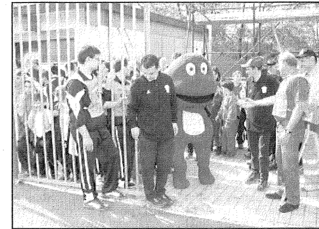
Scende in campo anche il Gabibbo