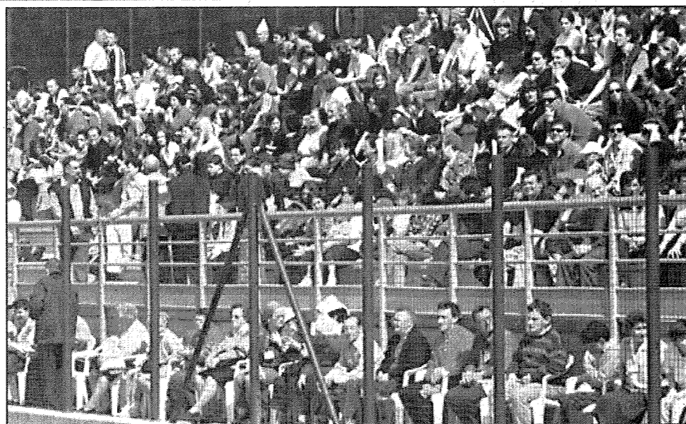
Oltre 1.200 spettatori alla partita

Mettersi i calzoncini vuol dire tornare bimbi e voler vincere a tutti i costi. Ma quello che è davvero importante è vincere la battaglia della solidarietà. Se poi, come oggi, arriva anche il risultato sul terreno di gioco, tanto di guadagnato».