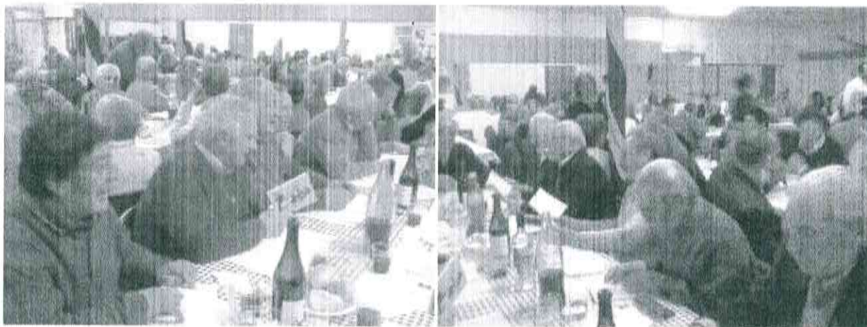
Il gruppo alpino di Calco